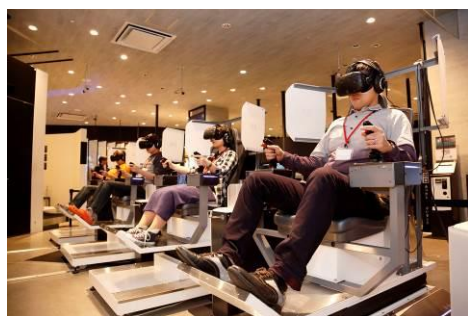
VR ZONE Project i Can