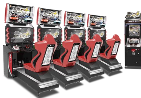
湾岸ミッドナイトマキシマムチューン 5DX PLUS