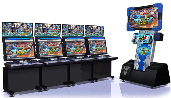
機動戦士ガンダム エクストリームバーサス マキシブースト ON

Disney Magical World: Magical Happy Mirror / PAC-MAN SMASH SLIM LINE