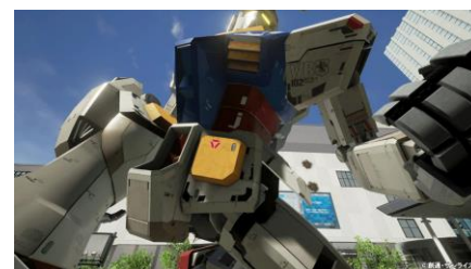
ガンダム VR「ダイバ強襲」