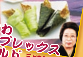
三よ志「手巻き餃子」