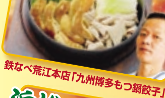
鉄なべ荒江本店「九州博多もつ鍋餃子」