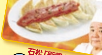
石松「衝撃の赤餃子」