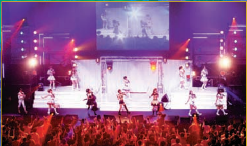
終盤では新キャラの我那覇響と四糸貴音が初公開。そして星井美希の961プロダクション電撃移籍が明らかに!ラストは熱いアンコールにお応えして「THE IDOLM@STER」出演者全員で熱唱!夢の3時間でした!