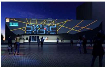
Die Anlage von außen

Des Weiteren wird die VR ZONE SHINJUKU auch eine Anzahl vieler neuer VR Aktivitäten bieten, die Gästen unter anderem erlauben eine Fantasiewelt auf einem geflügelten Fahrrad zu erkunden, eine mit Horror erfüllte Flucht vor Dinosauriern zu erleben, und vieles mehr. Jede Aktivität wurde so entworfen, dass die Gäste ganz in die VR Erfahrung eintauchen werden. Gäste können sich auch an einer Reihe von nicht VR Aktivitäten erfreuen, wie z. B. einen expandierenden Riesenballon in einer geschlossenen Zelle zu überleben, Andenken zu kaufen, sowie Essen und Aktivitäten in einem virtuell simulierten Essbereich eines Ferienortes zu genießen. All diese Möglichkeiten sorgen für ein abwechslungsreiches Entertainmentangebot. Zusätzlich kollaboriert BANDAI NAMCO Entertainment Inc. mit der beliebten Digital Art Gruppe NAKED, um, innerhalb und außerhalb der Anlage, Mapping-Projektion zu installieren. Die externen Projektionen werden PAC-MAN und andere Bilder zeigen, während im Inneren ein „Centre Tree“ posieren wird, welcher – als Schnittstelle der Anlage – den Gästen erlauben wird durch Berührung direkt mit dem Gebäude zu interagieren.