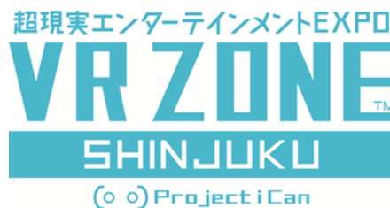
Logotipo de VR ZONE SHINJUKU