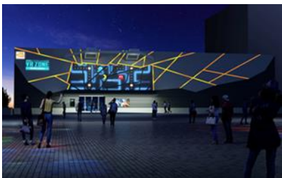
Imagen del exterior del establecimiento

VR ZONE SHINJUKU también incluirá una amplia gama de nuevas actividades de realidad virtual no pertenecientes a títulos propios, donde los asistentes podrán explorar un mundo de fantasía en una bicicleta con alas, vivir una frenética huida por la supervivencia entre dinosaurios, y muchas otras. Todas las actividades están diseñadas para que los usuarios se sumerjan en una experiencia de realidad virtual envolvente. El público también podrá gozar del ocio ajeno a la realidad virtual, como sobrevivir en una celda a un globo gigante en expansión, comprar recuerdos originales, y disfrutar de comidas y actividades en un restaurante simulado virtualmente a modo de parque temático, lo que pone la guinda en el pastel a una extraordinaria experiencia de entretenimiento. Además, BANDAI NAMCO Entertainment Inc. se ha asociado con el popular grupo de arte digital NAKED para el desarrollo de instalaciones de proyección de contenidos, tanto interiores como exteriores. Fuera contará con una proyección de PAC-MAN, entre otras imágenes, mientras que en el interior un “Árbol central” servirá como interfaz del centro de ocio, y permitirá a los usuarios interactuar con el propio edificio a través del tacto.