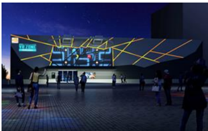
Image de l'extérieur du complexe

VR ZONE SHINJUKU comprendra également une vaste gamme d'activités en réalité virtuelle non lié à une franchise, où les joueurs pourront vivre des expériences uniques, comme explorer un monde fantastique sur un vélo ailé, survivre dans un univers horrifique plein de dinosaures, et bien d'autres choses. Chaque activité est conçue pour que les participants soient entièrement plongés dans l'expérience immersive qu'est la réalité virtuelle. Mais il y aura aussi toute une gamme d'activités non liées à la VR. Les visiteurs pourront essayer de sortir d'une cellule fermée renfermant un ballon géant se gonflant peu à peu, acheter des souvenirs originaux, ou encore profiter de plats et divertissements dans une zone de restauration virtuellement simulée pour que leur expérience soit tout à fait complète. En plus de tout ça, BANDAI NAMCO Entertainment Inc. a fait équipe avec le célèbre groupe d'art digital, NAKED, pour mettre en place des projections lumineuses à l'intérieur et à l'extérieur du complexe. A l'extérieur, les visiteurs retrouveront notamment une projection de PAC-MAN, tandis qu'à l'intérieur un "Arbre central" servira d'interface au complexe : d'une simple pression, les visiteurs pourront interagir avec le bâtiment même.