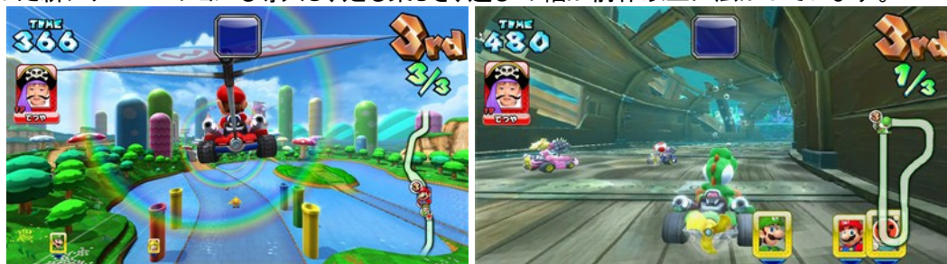
※ゲーム画面/「空を飛ぶ」

「空を飛ぶ」「水に潜る」といった新シチュエーションも導入し、走る楽しさ、遊びの幅が前作以上に広がっています。