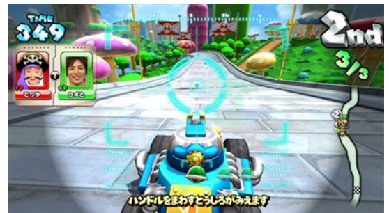
※ゲーム画面/合体カート （「攻撃」担当側プレイヤー画面）

チーム2人が一定距離接近して走ることでそれぞれのカートが「シールド」をまとい、ライバルチームからのアイテム攻撃を防ぐことができます。