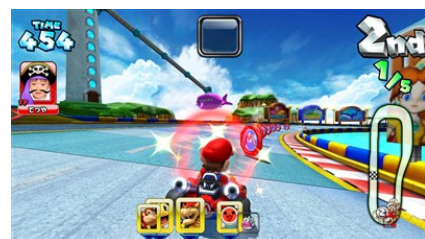
※ゲーム画面/マリオコイン

アイテムやカートは、レース中に手に入る「マリオコイン」を集めることで獲得でき、コレクションを増やして楽しむことができます。