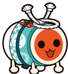
※太鼓の達人「どんちゃん」

今作から新たに登場するキャラクターとして、国民的音楽ゲーム「太鼓の達人」から人気キャラクター「どんちゃん」が参戦。オリジナルコースとして「太鼓の達人」の世界をテーマとしたコースが登場します。