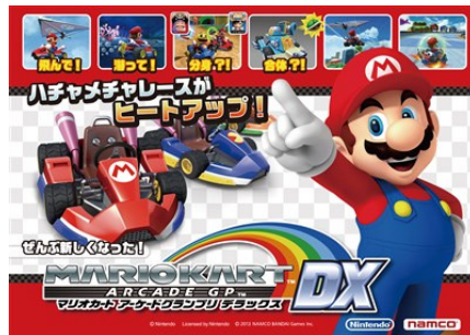
※イメージビジュアル

今作は、任天堂株式会社の家庭用人気アクションレーシングゲームシリーズ「マリオカート」をアーケード向けに開発したもので、2007年3月発売の「マリオカート アーケードグランプリ 2」から6年ぶりとなる最新作です。なお、発売に先駆け2月15日・16日に幕張メッセで開催される「ジャパン アミューズメントエキスポ 2013」に出展します。