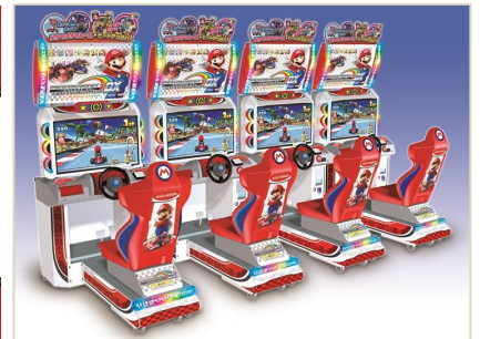
※ゲーム機イメージ