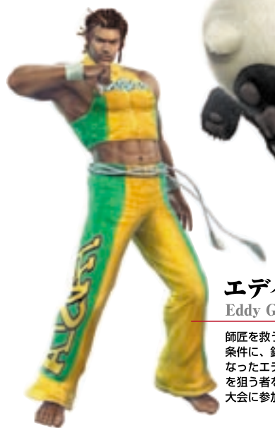
エディ・ゴルト Eddy Gordo

盟友となったマードックを襲ったアーマーカーキングの姿をした犯人を誘い出すため、キングはマードックとともに再び大会に参加する。