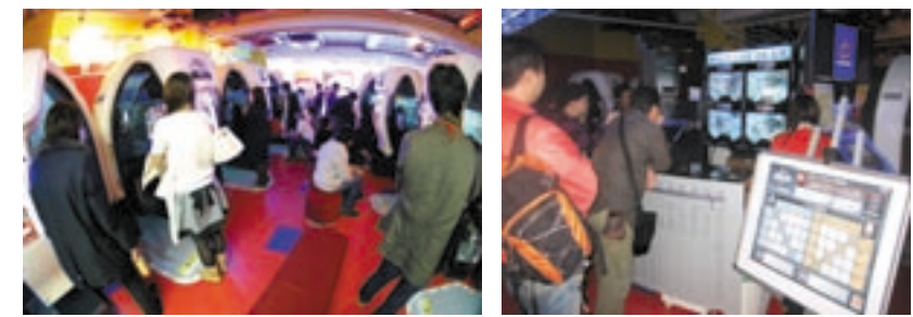
11月3日に開催されたナムコランド 渋谷店でエリア予選の様様。 ナムコランド渋谷店の優勝チーム決定戦に熱い視線を送るギャラリーの皆さん。

「機動戦士ガンダム 戦場の絆 2007オフィシャル全国大会 ver0.1」は、本ゲーム初の公式大会だ。2008年に予定している全国大会の前哨戦としての位置づけのため、実験的にバンダイナムコグループの店舗のみで実施される。予選大会は11月3日より順次開始。4人1組によるチーム戦を勝ち抜いた総勢12+4チームにて、12月22日に決勝大会が行われるぞ。