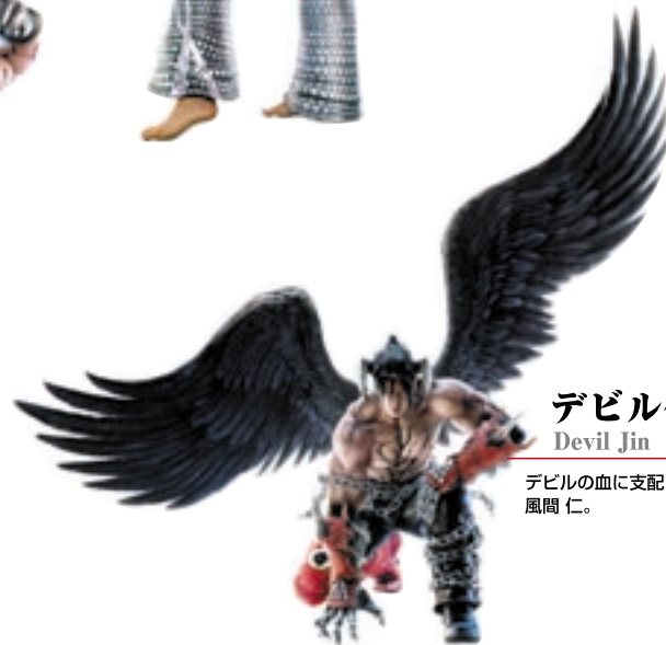
デビル仁 Devil Jin

姿を消したエディと祖父の行方をつかむため、クリスティは三島財閥への接触をもちこむ。