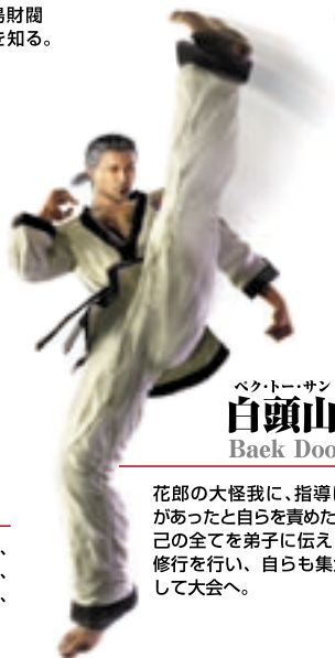
ベクトー・サン 白頭山 Baek Doo San

世界を巻き込む戦争の元凶、三島財閥。その頭首・風間 仁が、自分の親戚と知った飛鳥は、仁をしばくため大会に参加する。