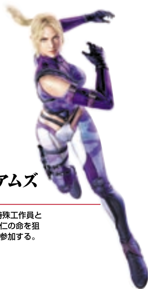
アンナ・ウィリアムズ Anna Williams

三島財閥の頭首、風間 仁に特殊工作員としてスカウトされたニーナ。仁の命を狙う者を始末するため、大会に参加する。