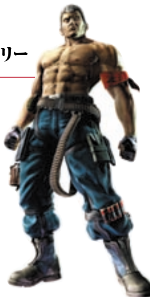
ブライアン・フューリー Bryan Fury

花郎の大怪我に、指導に不備があったと自らを責めたベク。己の全てを弟子に伝えるべく修行を行い、自らも集大成として大会へ。