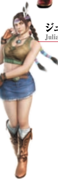
ジュリア・チャン Julia Chang

三島財閥の宝物殿から神拳奥義之書を奪還した馮。さらなる高みを求め再び大会へ参加する。