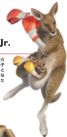
ロジャーJr. Roger Jr.

三島財閥の新頭首・風間 仁にヘリコプターから北海道の原野に投げ捨てられたクマ。何とか生き延び、再び三島財閥本部を目指す。