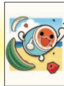
太鼓の達人(和田ドン) "夏にはやっぱりスイカだぞ!" 7/11 配信