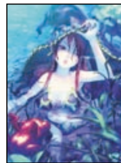
せせらぎのヴィヴィ(ヴィーナス&プレイブス) "セクシー&キュート!" 7/11 配信