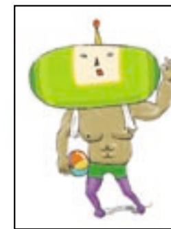
筋肉(塊魂) "ムキムキ" 7/21 配信