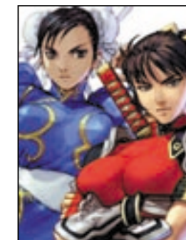
「ソウルキャリバーII」に登場する「タキ」と「ストリートファイターシリーズ」に登場する「春麗」