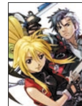
オリジナルキャラクターありすれいし シャオムの「有格零児」と「小羊」