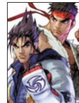
「鉄拳シリーズ」に登場する「風間仁」と「ストリートファイターシリーズ」に登場する「リュウ」