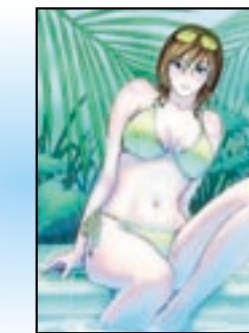
吉乃ひとみ "ここでしか見れないひとみの水着姿" 7/21 配信