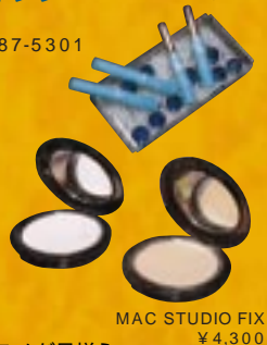
MAC STUDIO FIX ¥4,300

日本では、入手しがたい人気の輸入ものコスメが品揃えバッチリでインティに登場。しかも、買うだけでなく、予約すれば、実際にタレントやシンガーのメイクを担当しているプロのヘアメイクさんにメイクしてもらえる。