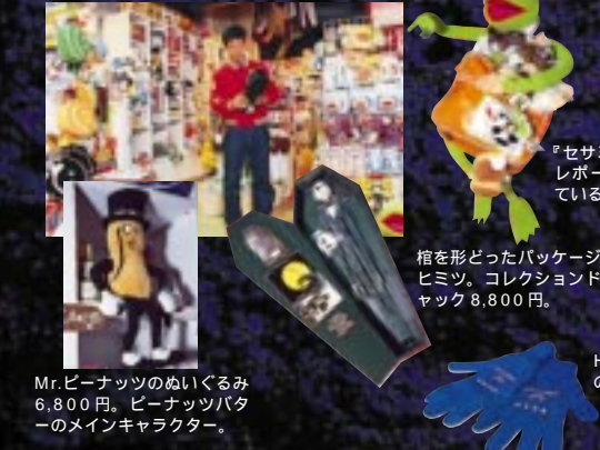
『セサミストリート』のレポーター役で活躍しているカーミット。 棺を形どったパッケージが人気のヒミツ。コレクションドール・ジャック 8,800円。 Mr.ピーナッツのぬいぐるみ 6,800円。ピーナッツバターメインキャラクター。 HARUKO&METROの手袋 1,200円。

こちらは、比較的ファンシー系が揃っている。どちらかという、女の子向けかも。去年の年末くらいから、「ナイトメア・ビフォー・クリスマス」シリーズの人気の上昇中。