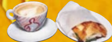
コクのある特製エスプレッソ 260円 ハム&チーズのパニーニ 350円

アメリカ人がハンバーガーなら、こちらイタリア人は、パニーニというくらい、イタリアではものすごくポピュラーなファーストフードだとか。トーストしてあるから、パリッパリとした食感と香ばしさが食欲をソノる。