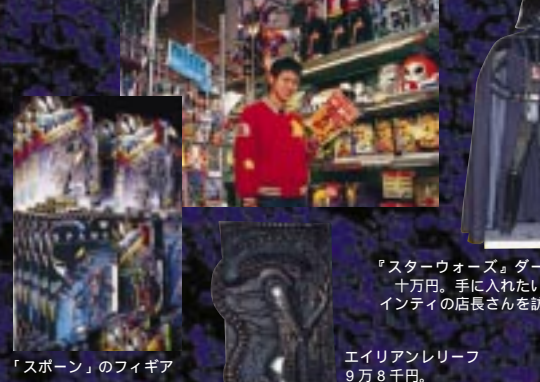
『スターウォーズ』ダースベーター十万円。手に入れたという人は、インティの店長さんを訪ねてみて！ 「スポン」のフィギア エリアンレリーフ 9万8千円。

日本ではまだまだ知られていないキュートな小物や外国アニメやムービーのキャラクターが所狭しと並んでいる。映画『SPAWN』のキャラクターグッズ、なかでもフィギアは要チェック！