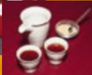
冷やでも熱カンでもイける。名物瓶出し紹興酒。小杯 480円・大杯 870円