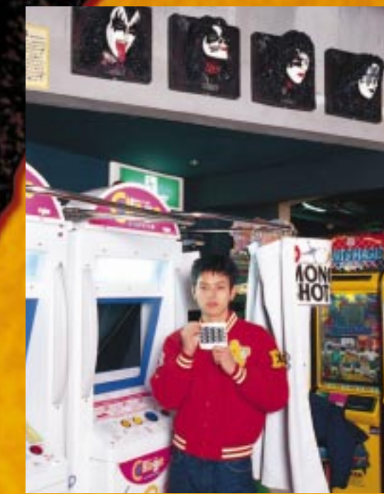
さりげなくある「KISS」のフェイスフィギア。この他にも、ギズモやヨーダなど実物大映画フィギアが、隠れキャラのおかれている。

ゲームの話に戻ると、「怖いものやりたさ」で人気の高い電気椅子の『Shocker』やエアで泳いでいるピンポン玉をつかんでプターの口にほっぺりこむ『つかんでポン』などが最近、インティで人気上昇中のゲームだぞ。 そういつているうちに、「そいつは、お腹すいてきたよね」といつか、向ったのが『Cafe FEAST』。イタリアでは、ハンバーガーのように親しまれているというパニーニをほおばり、カプチーノを飲みながら、メインフロアを眼下に食事タイム。そしてデザートは『おたべ茶屋』のアイスマナガで決まり。ここからの眺めは、ゲームスポットというより、ライブハウスやクラブといった感じ。こんな風にスペース全体の雰囲気がいから、極端な話、ゲームをやらなくても、いるだけで楽しめるしまつ。それが、インティのスコイとこるなんだよね。進化しつづけているインティに、これからも眼が離せそつくないー！